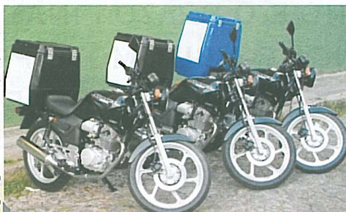
Mudança dispensaria a obrigatoriedade de baú e matacachorros

✔ Quem não tiver seu nome como proprietário da moto na documentação pode fazer o contrato de COMODATO;